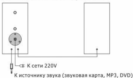
Схема подключения к источнику сигнала