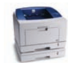
Принтер Phaser 3435 с дополнительным лотком 2